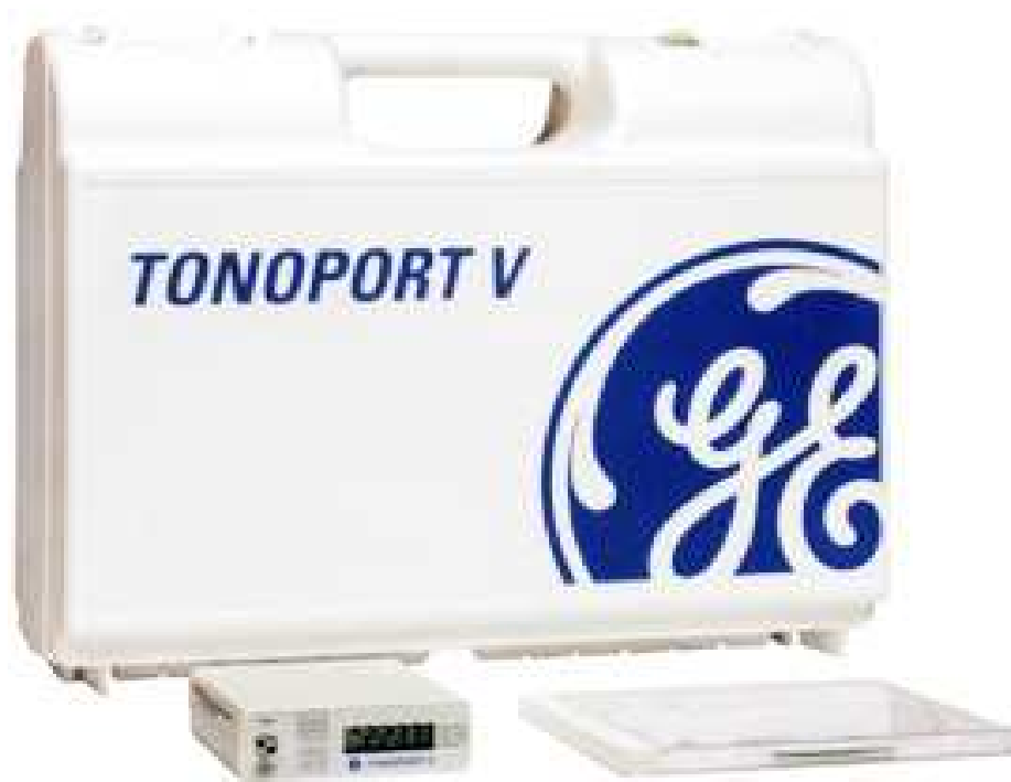
Рисунок 1- Монитор 24 часовой регистрации АД пациента носимые Tonoport V

Конструктивно регистраторы АД состоят из носимого монитора, манжеты пневматической и адаптера для соединения с компьютером.